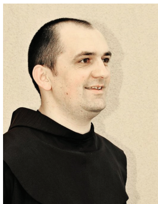
Fra Tihomir Bazina